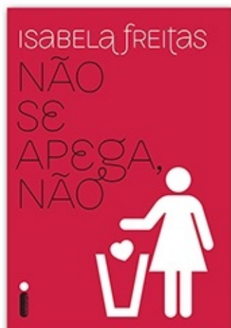
Não se apegue, não