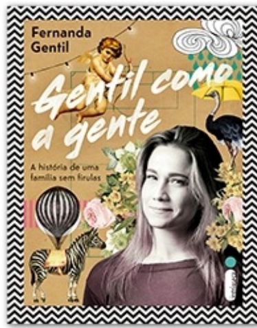
Gentil como a gente Fernanda Gentil