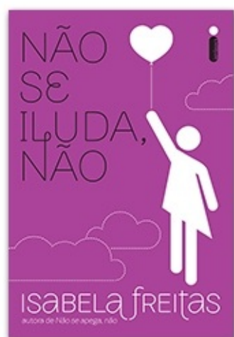
Não se iluda, não